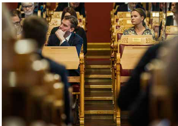
Stortinget: Raudt vil be Stortinget ta stilling til en rekke forslag om profittfri velferd.

Det er fellesskapets ansvar å beskytte utsette barn og sørge for at alle barn får vekse opp i trygge omgivelser og får hjelp i tråd med sine behov. Utviklinga av barnevernet må vere basert på barnas beste, ikkje på økonomiske motiv. Vi kan ikkje overlata omsorga for dei mest sårbare barna og ungdommane til profittsøkande selskap. Raudt vil ha ein forpliktande opptrappingsplan for avvikling av anbodssystemet i barnevernet, som sikrar at dagens kontraktar med kommersielle selskap ikkje vert fornya når dei går ut, og at enkeltkjøp skal verte avslutta. Opptrappingsplanen skal sikre at eigarskap og drift i barnevernet er offentleg eller i langsiktige samarbeid med ideelle aktørar.