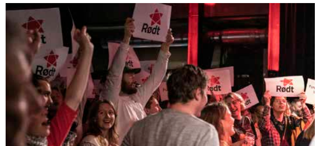
Rekord: Rødt rigger for rekordvalg i 2021.