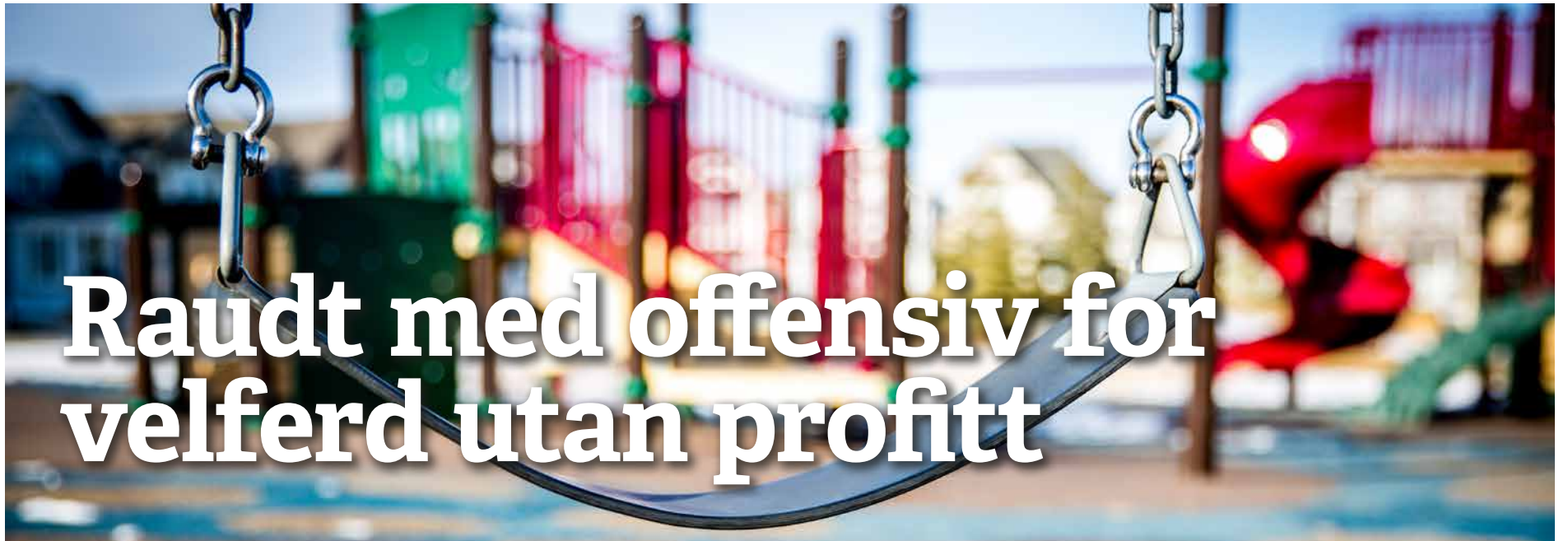
Melkeku eller fellesgode? Rødt vil ha profittmotivet ut av barnehagene.