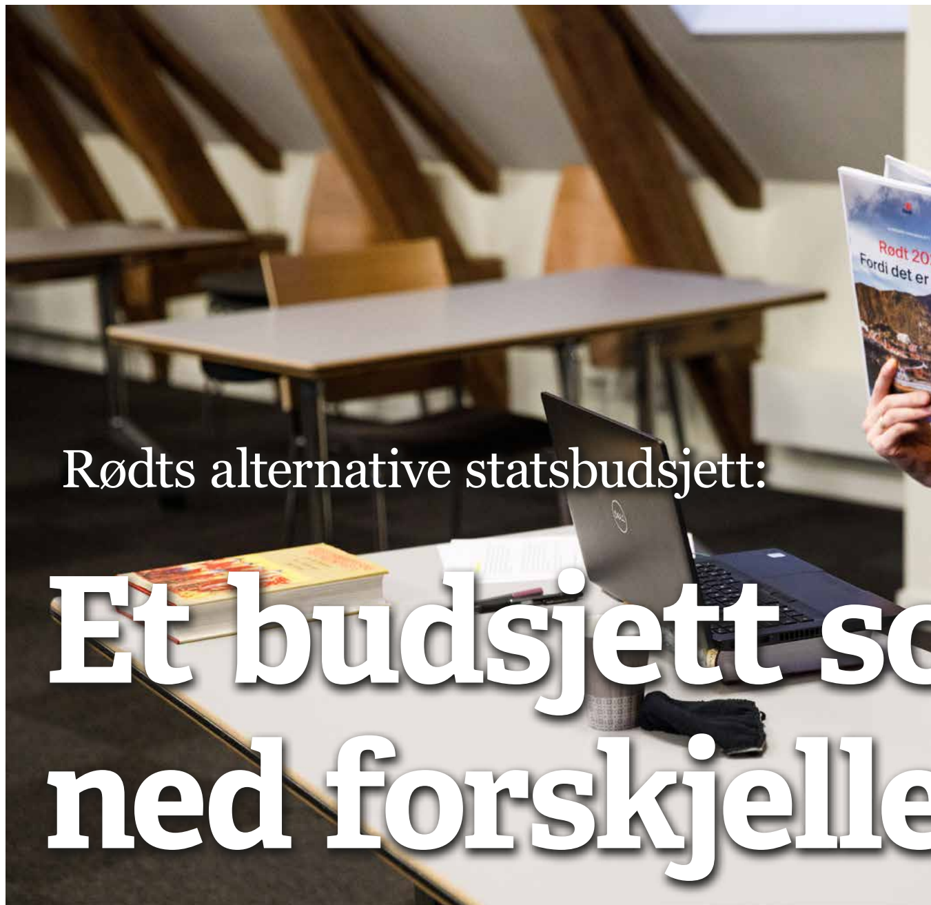
Pressekonferanse: Rødts budsjettlanisering i november var preget av digitale løsninger og strenge smittevernstiltak.

Utgiver: Rødt Dronningens gate 22 0154 Oslo