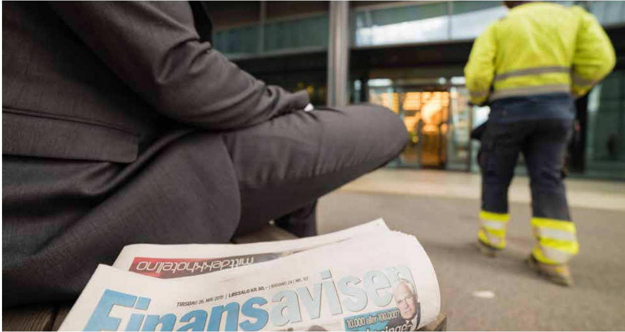
Nye tall: 7 av 10 nordmenn mener det er store forskjeller i Norge.