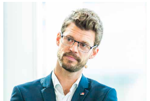
Rødt-leder: Bjørnar Moxnes.

I Rødts alternative statsbudsjett foreslår partiet en egen krisepakke for inntektssikring på til sammen 7,4 milliarder. Et av hovedforslagene i pakka er