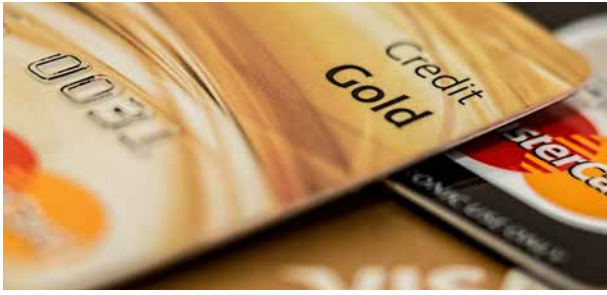
Rekordnivå: Nordmenns misligholdte lån har økt med 7 milliarder siden i fjor sommer.