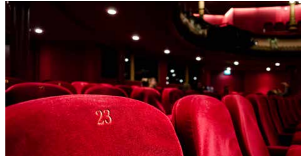
Sliter: Kulturlivet er i krise på grunn av nedstengninger.