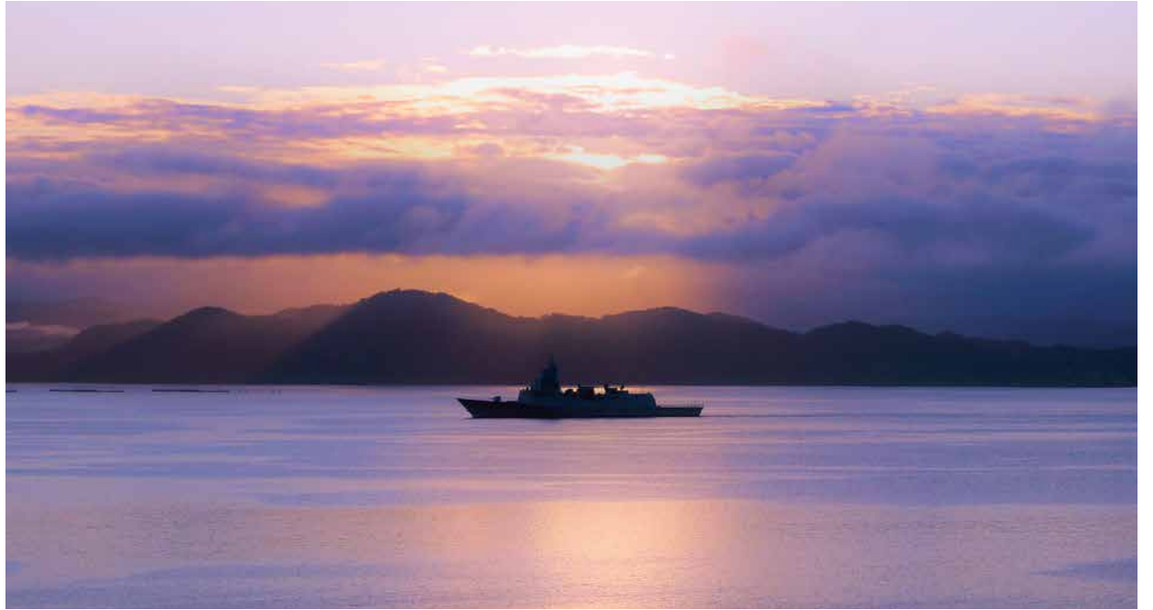
Bør bli i Norge: Fregatten KNM Thor Heyerdahl i Korsfjorden 2018.