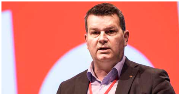
LO-leder: Hans-Christian Gabrielsen.

– Forskjellene øker hvert eneste år. Høyre regjeringen bidrar til å øke dem heller enn å