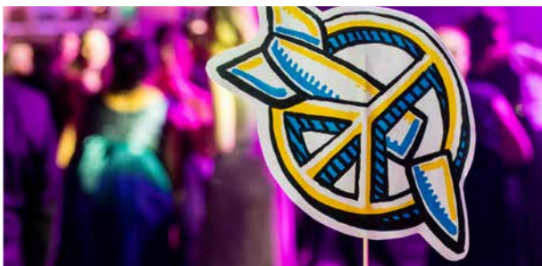
Forbudt: Det internasjonale forbudet mot atomvåpen trer i kraft i januar.