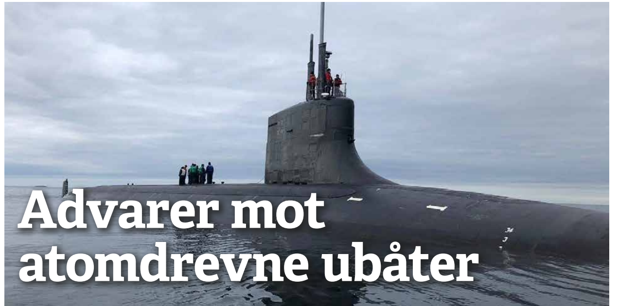
I Tromsø: Ubåten USS Seawolf i Tromsø i august 2020.